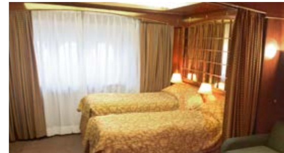
PREMIUM SUITE 30 qm 2 ; Doppel- oder zwei Einzelbetten; Balkon