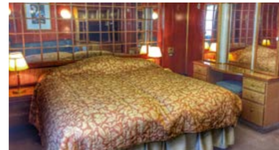
SUPERIOR SUITE 22 qm 2 ; Doppel- oder zwei Einzelbetten; Fenster