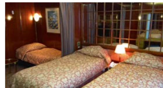
CLASSIC-DREIBETT SUITE 21 qm 2 ; 2 Einzelbetten, Sofa Bett; Fenster