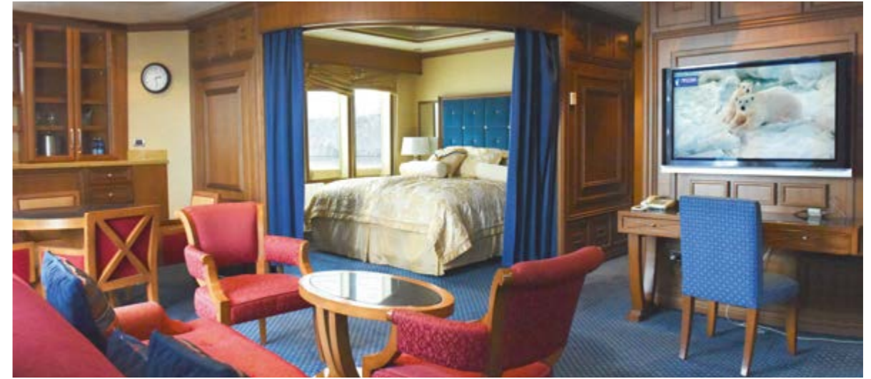
EIGNER SUITE 43 qm 2 ; Doppelbett, private Decksfläche über der Brücke