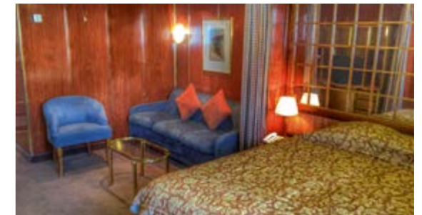
CLASSIC SUITE 21 qm 2 ; Doppel- oder zwei Einzelbetten; Fenster.