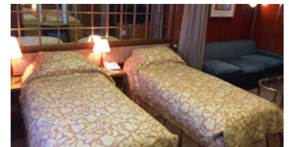
MAINDECK SUITE 23 qm 2 ; Doppel- oder zwei Einzelbetten; Bullaugen.