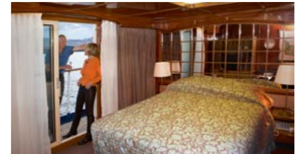
DELUXE SUITE 24 qm 2 ; Doppel- oder zwei Einzelbetten; Balkon